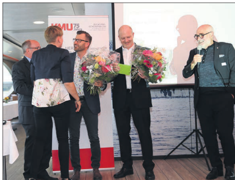
Die abtretenden Vorstandsmitglieder erhalten einen Blumenstrauss.