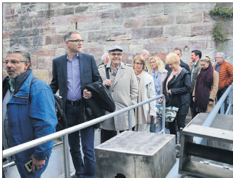
Die erwartungsfrohen Gäste beim Boarding Richtung «Rhystärn».

Ein opulentes Dessertbuffet setzte dem perfekt organisierten Abend zur Freude aller Anwesenden die kulinarische Krone auf.